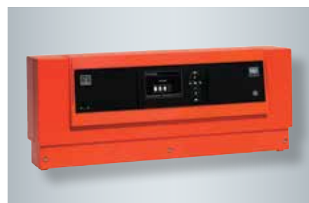
Kaskádová regulace Vitotronic 300-K.

Pro regulaci kaskády je k dispozici Vitotronic 300-K. Displej se srozumitelným textem s grafickou podporou poskytuje vysoký komfort obsluhy. Na přání lze Vitodens 200-W přes zařízení Vitogate 200 zapojit i do systémů automatizace budov.