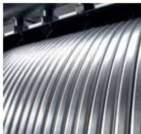
Inox-Radial – vysoce účinný patentovaný tepelný výměník.

10 let záruka na výměník tepla Inox-Radial pro kotle do 150 kW